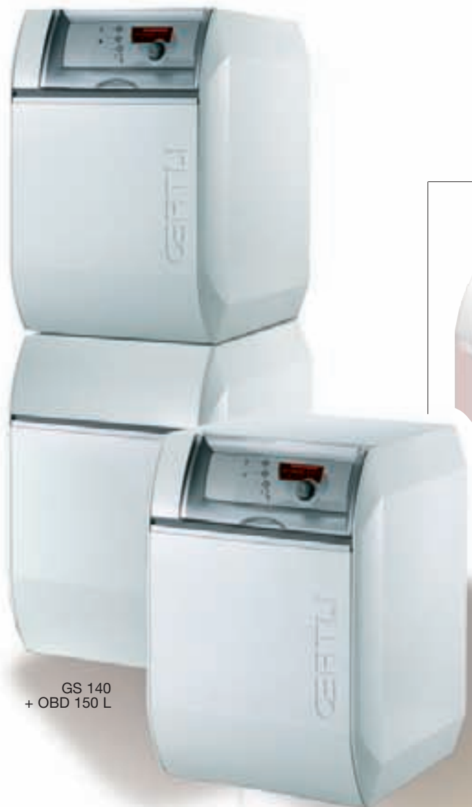
GS 140 + OBD 150 L

La gamme GS 140 séduit d'emblée par son design élégant et innovant. L'esthétique et l'ergonomie de ces chaudières ont bénéficié d'un grand sens du détail pour répondre aux tendances actuelles et simplifier leur utilisation et leur entretien. Le corps de chauffe en fonte eutectique, parfaitement résistante aux variations de température et à la corrosion, permet le fonctionnement en basse température de départ modulée jusqu'à 30°C, optimisant ainsi le rendement, la fiabilité et la longévité de la chaudière.