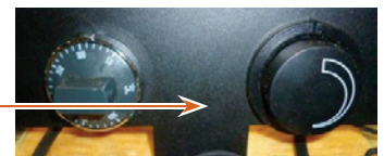
Tableau de commande simplifié, indication température, interrupteurs pompe et ventilateur

Réglage installateur temp. maxi chaudière (coupure ventilateur) et temp. mini fumées (maintien de braises)