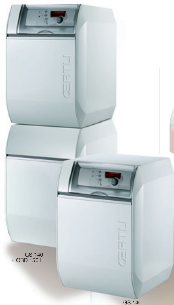
GS 140 + OBD 150 L

Par ailleurs, elles peuvent être associées à un préparateur d'eau chaude sanitaire de 150 litres à placer sous ou à côté de la chaudière.