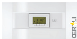
Tableau \mathcal{E} -Control permet de piloter 1 circuit de chauffage et la préparation e.c.s. le cas échéant